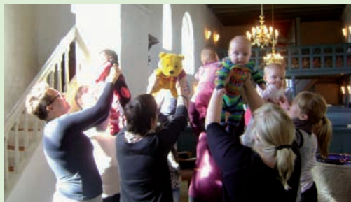
Foto fra babysalmesang i Vilslev kirke

Der er kaffe/thé og en småkage med plads til hygesnak efter babysalmesangen.