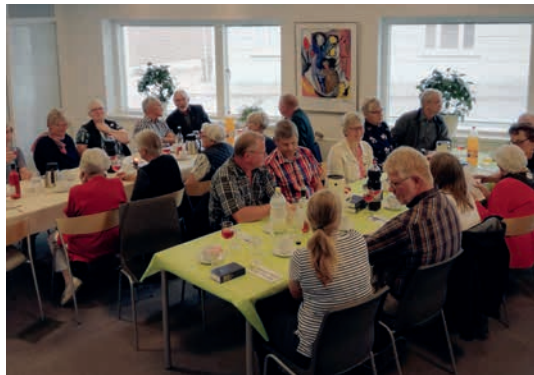
Mange var mødt op på den store dag

Da stillingsopslaget til den nye præstestilling skulle skrives, valgte man at opgive bopælspligten med tanke på at sælge præsteboligen i Jernved.