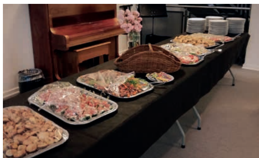
I Sognehuset ventede der gæsterne en lækker buffet

Og det tager tid. Alt er jo stadig så nyt. Der er meget, jeg endnu ikke ved om sognene, så man-