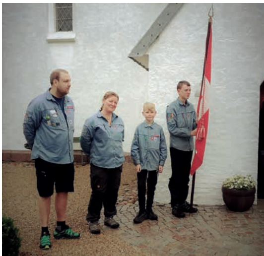
FDF var mødt op til indsættelsesgudstjenesten med festlig fanevagt